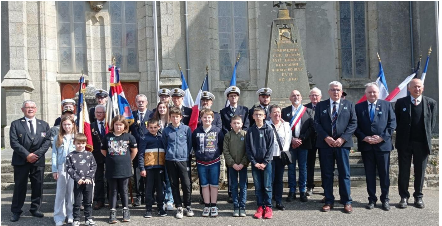
Les représentants des officiers mariniers et de l'UNC avec les enfants des écoles, les élus et le détachement du Centre de Transmission Marine de Kerlouan